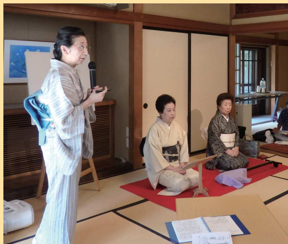
去年の講座風景（砂丘館）