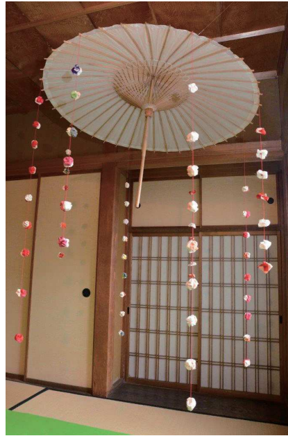
右上から左回りに、雛祭、節分、七五三、冬至、お月見、七夕、お正月