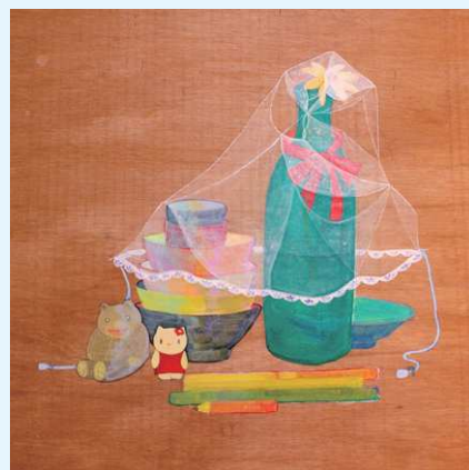
瀬尾夏美『もう一度立てなおす』2011年(アクリル絵の具、板)