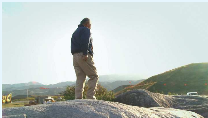
『波のした、土のうえ/まふしさに目の慣れたころ』2014年(映像17分)