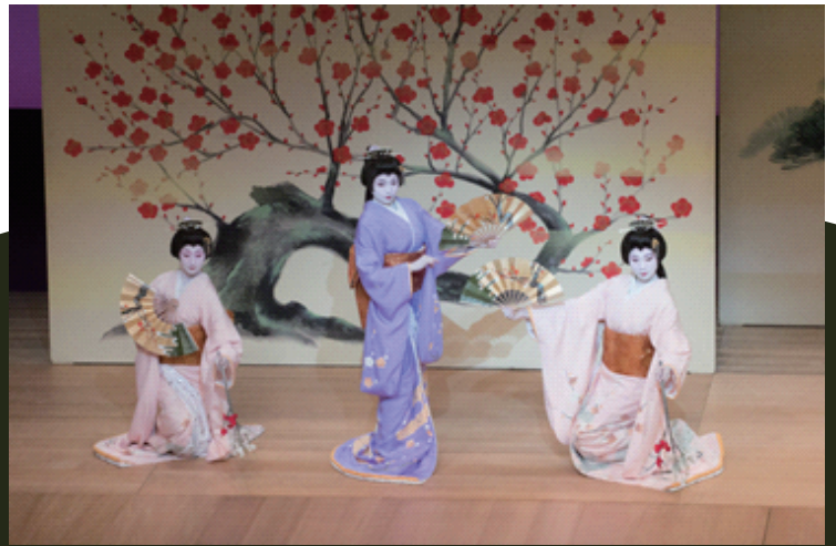
平成 29 年 ふるまち新潟をどりの舞台より

この「ふるまち新潟をどり」 を初心者でも楽しめるよう に、予習として花街・日本舞 踊・邦楽の<基礎の基礎>を 学ぶ講座です。学生さんや若 い方も大歓迎！