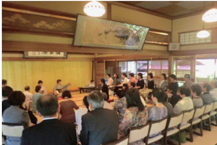
平成28年鍋茶屋会場での様子(イメージ)