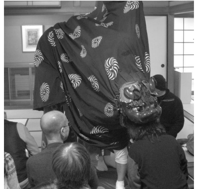
獅子が参加者ひとり一人の頭を噛んで厄を払います