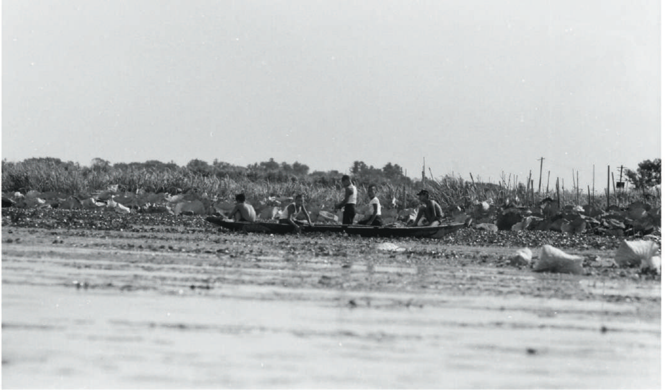
舟に乗る少年達