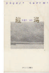
国見修二 詩集『鎧潟』1994年 土曜美術社 失われた鎧潟の記憶を見つめた一冊。