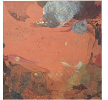
樋口峰夫「読み」1981年 岩絵具、紙 新潟市巻郷土資料館蔵 印象的な赤は、少年樋口が体感した潟の泥のイメージ。