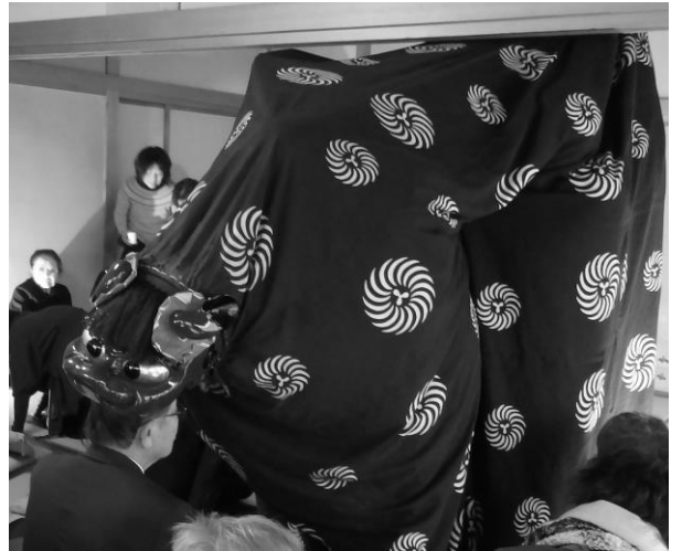
獅子が参加者ひとり一人の頭を噛んで厄を払います